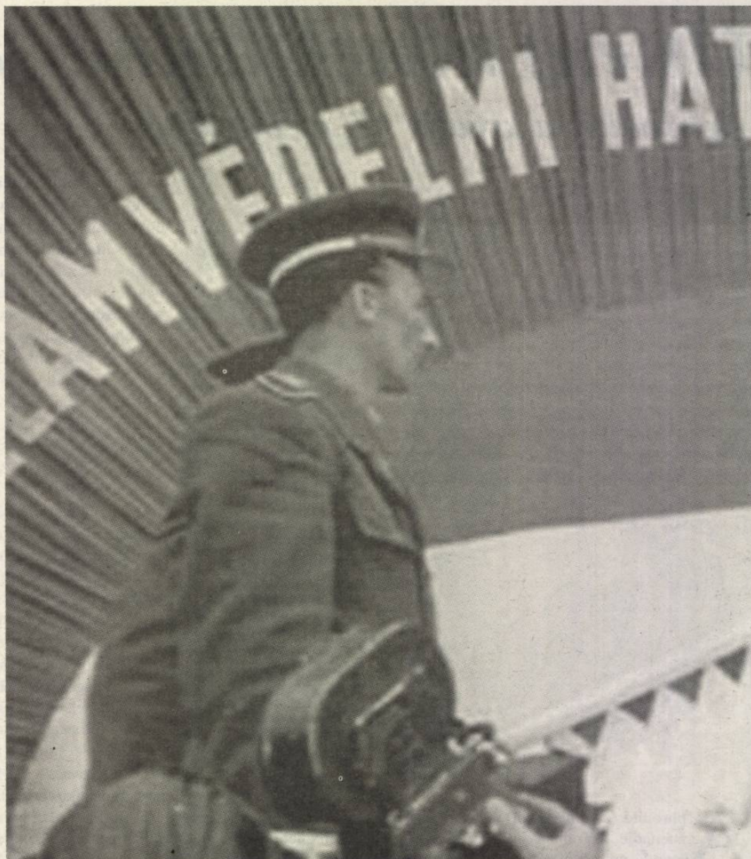
Állam szeme mindent lát... (Az óvó AVO)

Kérdés: „Mi a helyzet az állambiztonsági szolgálat magasabb rangú együttműködőivel, amilyen a magyar miniszterelnök is volt?” Válasz: „A különleges feladattal megbízott tisztakat eltávolították a közszolgálatból, mindegy, hogy az állambiztonság mely részlegénél dolgoztak. Ha lelepleződtek, távozniuk kellett, mert ők az előző