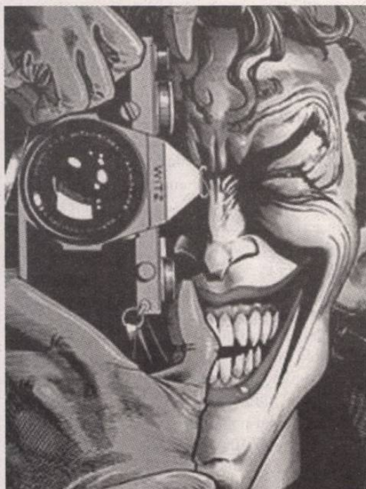
Az objektív és az ember

16. Az, hogy hazánk „a rosszul vezetett ügynyökök országa” – nem én mondom, bár szívesen vállalnám a szerzőséget, mert szellemes. De egy ügynyög az érdem, aki mellel(?) annak idején – anno decibel ; vagyis a most oly visszhangos évtizedekben – maga is a „Cégnél” dolgozott, tehát (ilyen alapon) akár tudhatja is: hogyan kell egy ügynyöket jól vezetni. Vajon mit jelenthet ez a bonmot az ő értelmezésében?